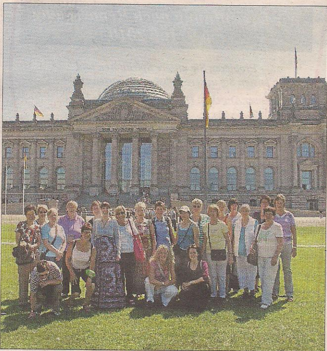
Auch der Bundestag war Ziel des Frauenchores.